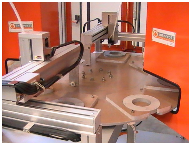
Sistemi dedicati per incollaggio di mole abrasive per marmi e vetro.